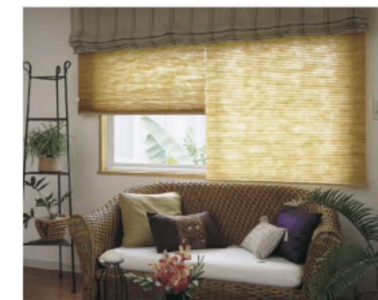
【18-9】プリーツスクリーン (タチカワブラインド)