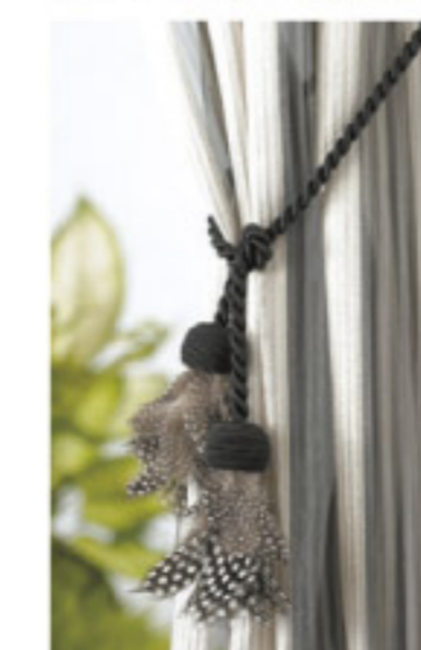
【18-15】フェザータッセル (タチカワブラインド)