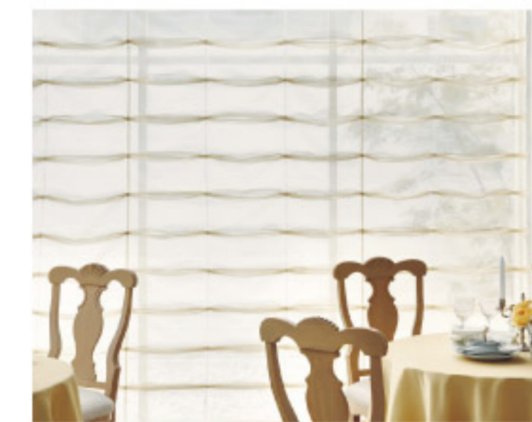
【18-13】キャンディシェード (SANGETSU CO.,LTD.)