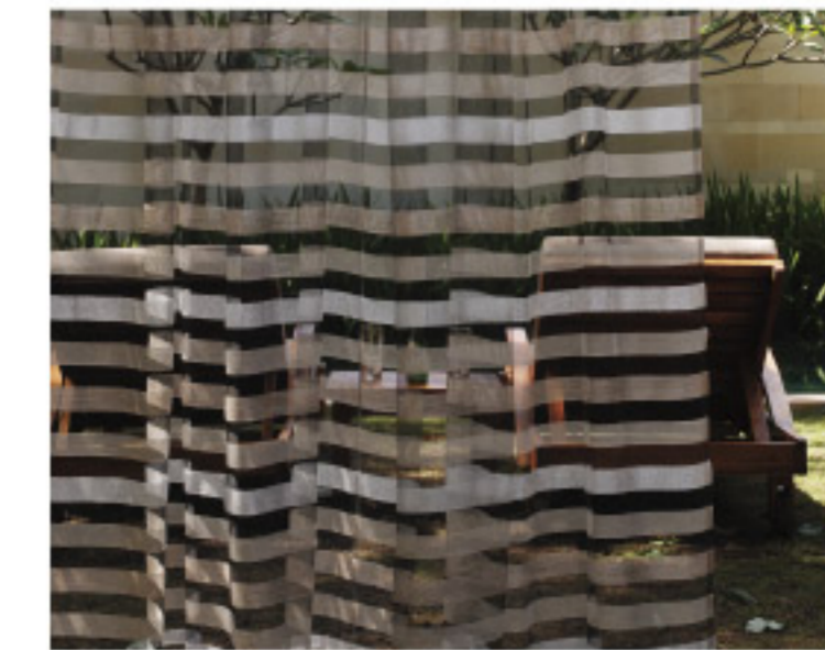
【18-2】VERANT (五洋インテックス)