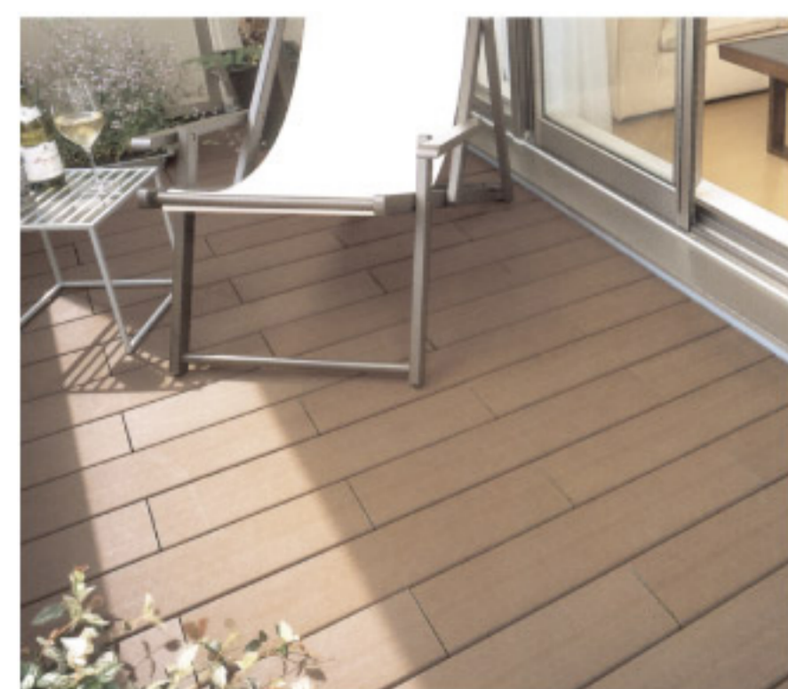
【17-5】リファールEXジョイントデッキ