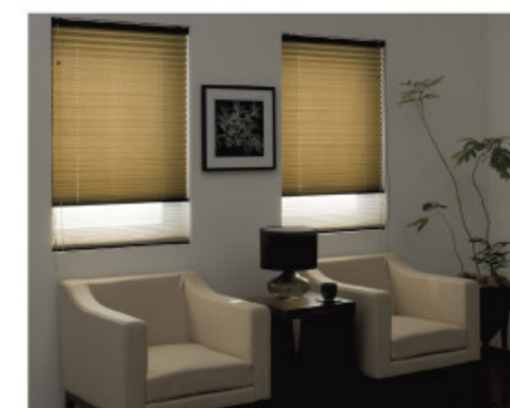
【18-16】簾 (タチカワブラインド)