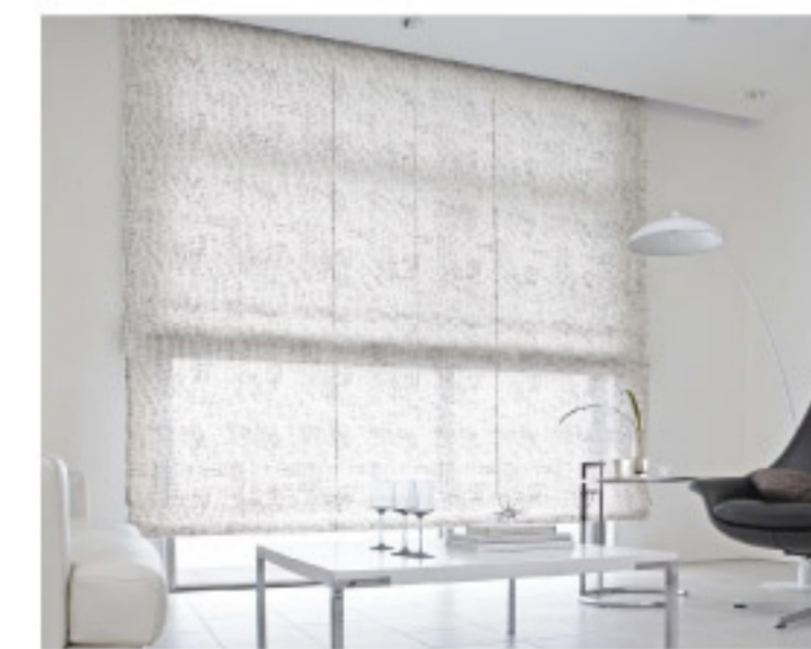
【18-12】ツインシェード (SANGETSU CO.,LTD.)