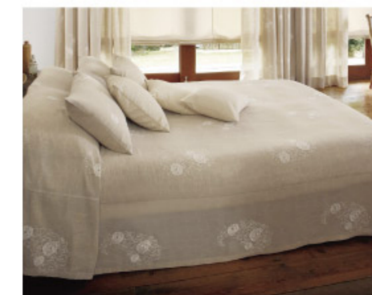
【18-17】ペットカバー (SANGETSU CO.,LTD.)