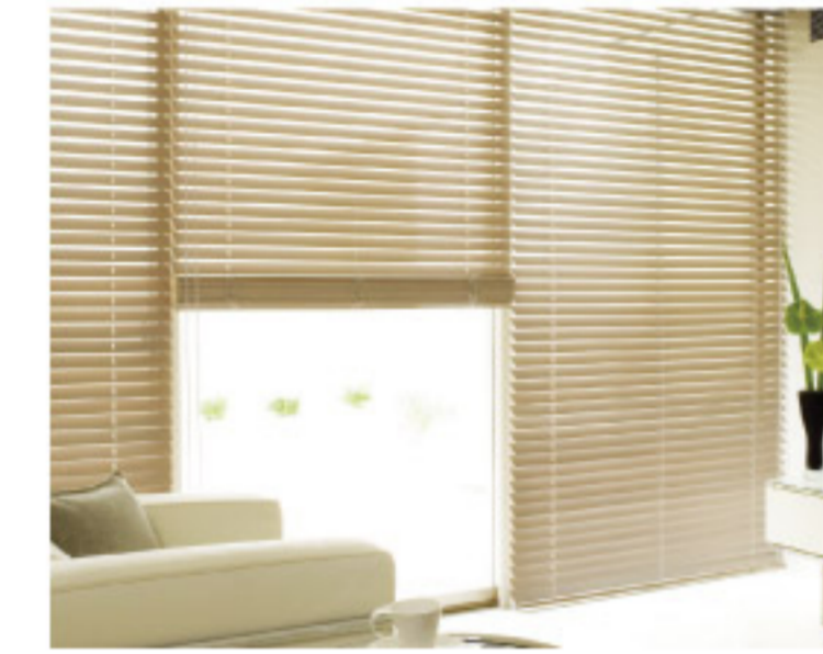
【18-6】木製ブラインド (タチカワブラインド)