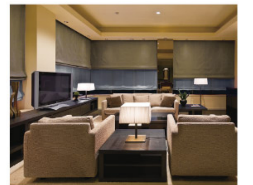
【18-10】シェード (タチカワブラインド)