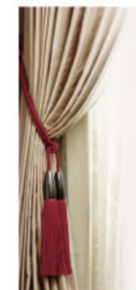
【18-11】タッセル (SANGETSU CO.,LTD.)