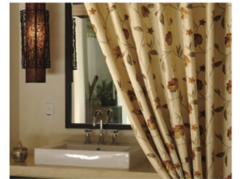
【18-3】MARANGES (五洋インテックス)