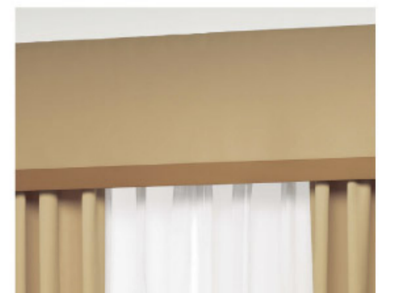
【18-18】ストレートボーダーバランス (SANGETSU CO.,LTD.)