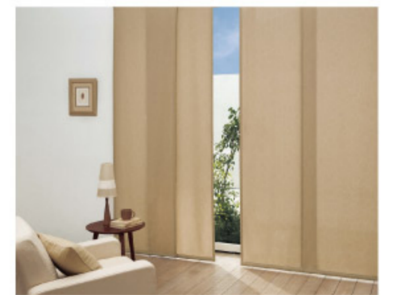
【18-14】パネルトラック (SANGETSU CO.,LTD.)