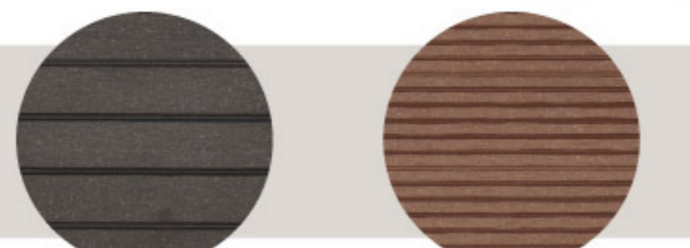
【17-6】オリジナル人工樹木デッキ