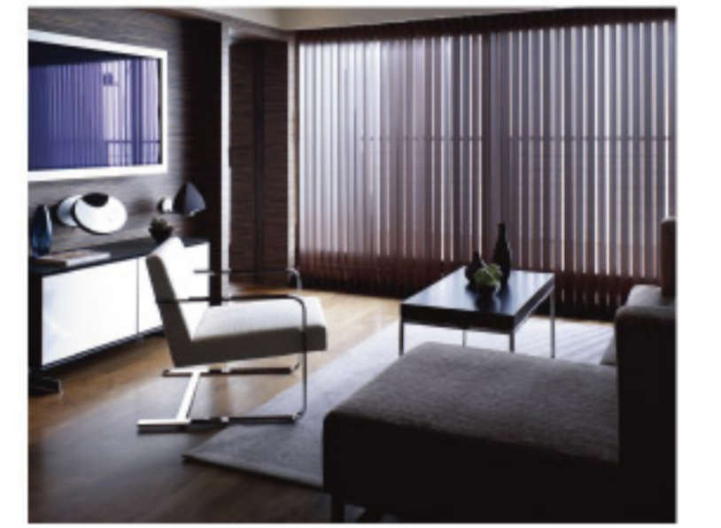
【18-7】ラインドレープ (タチカワブラインド)