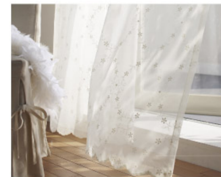
【18-8】紫外線カットレース (Lilycolor)