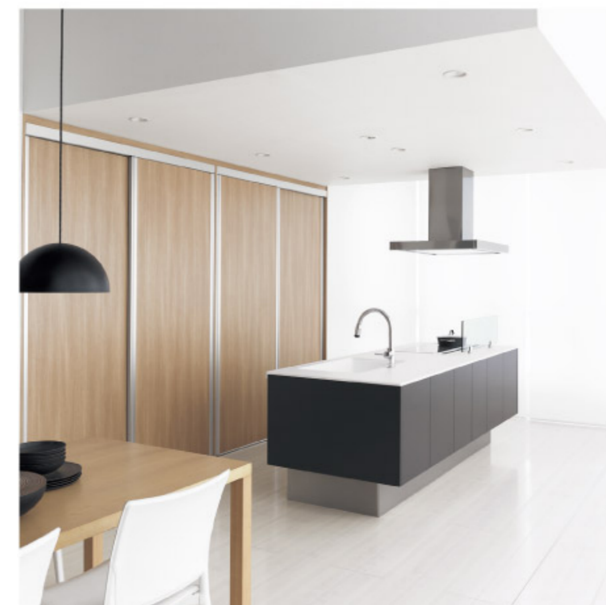
【14-11】Living Station L-class LH10シリーズ アイランドプラン (パナソニック電工)