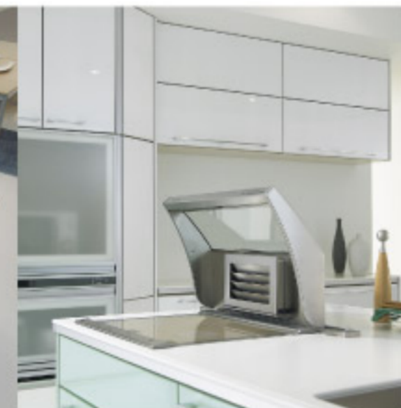
【13-10】IH用空気清浄システム (サンウェーブ)