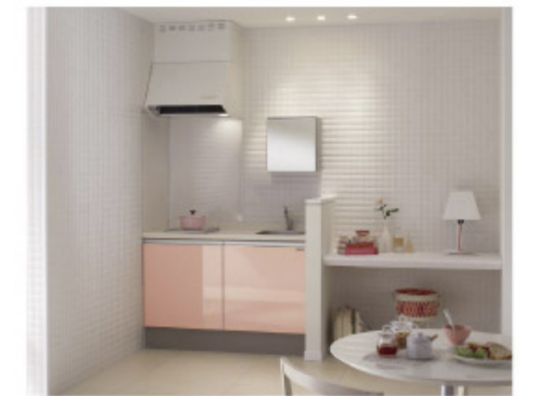
【14-8】コルティ Gシリーズ ピーチ (クリナップ)