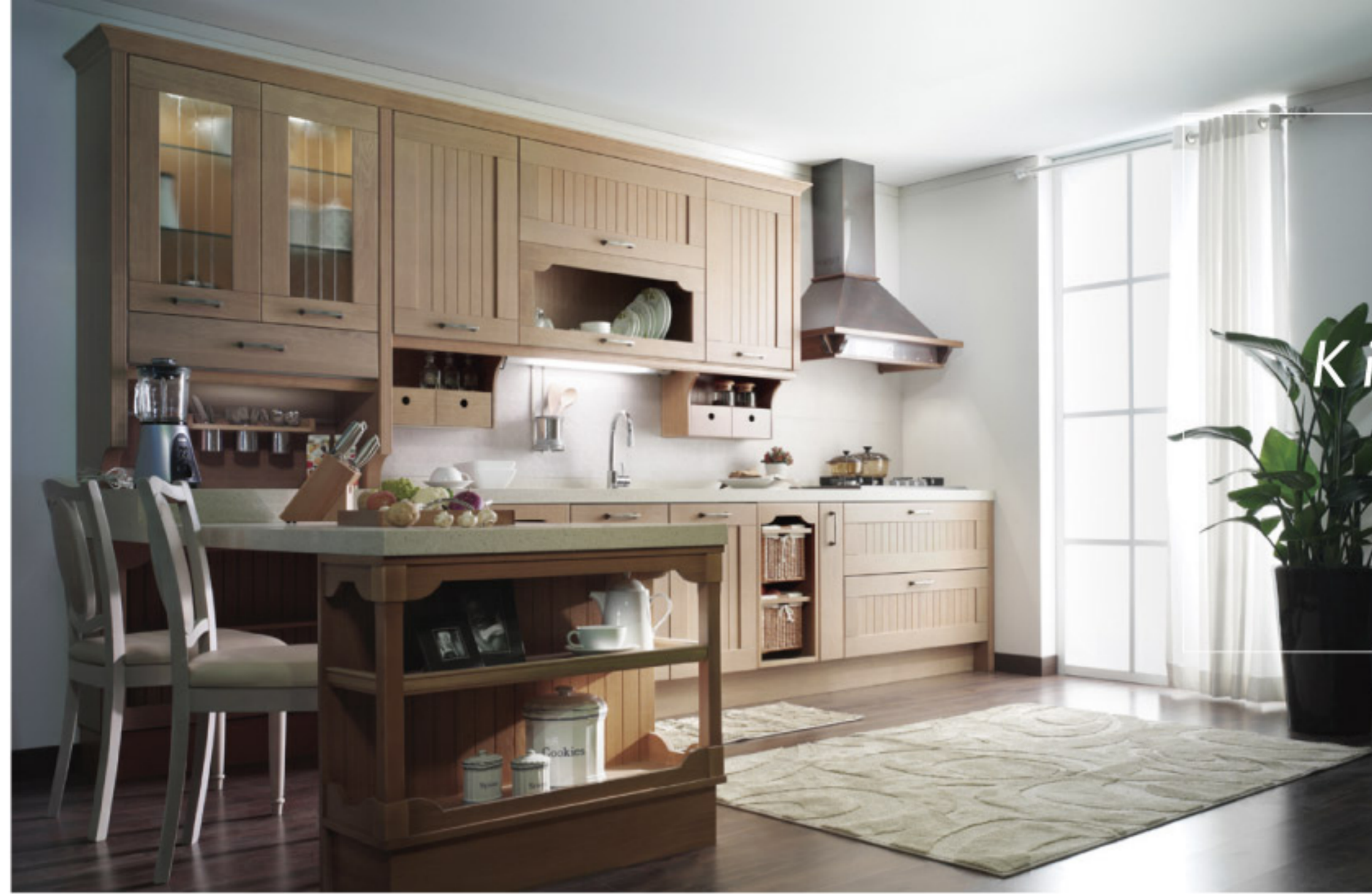
【13-1】オリジナルキッチン (RESEAU)