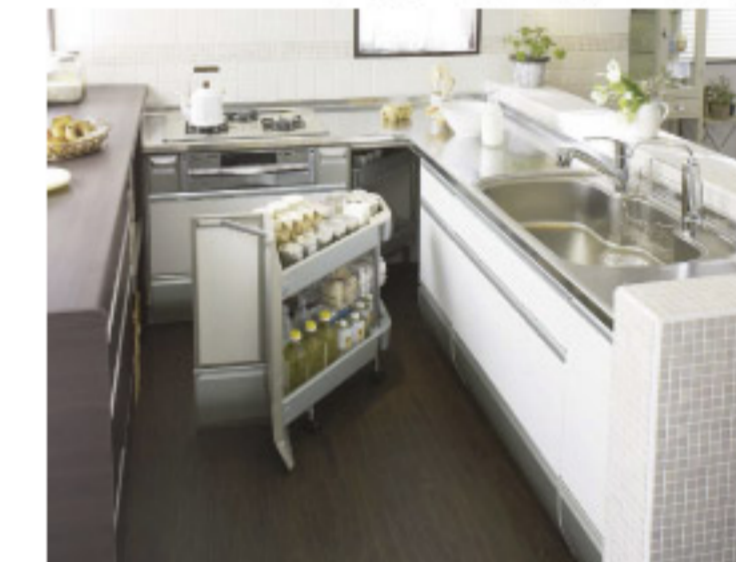
【14-9】クリンレディSTYLE 3 カフェスタイル 造作対面L型ステンレスワークトップ (クリナップ)