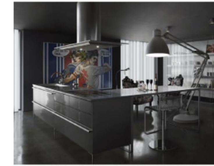
【14-2】CORE ソリッド (TOYOKITCHEN)