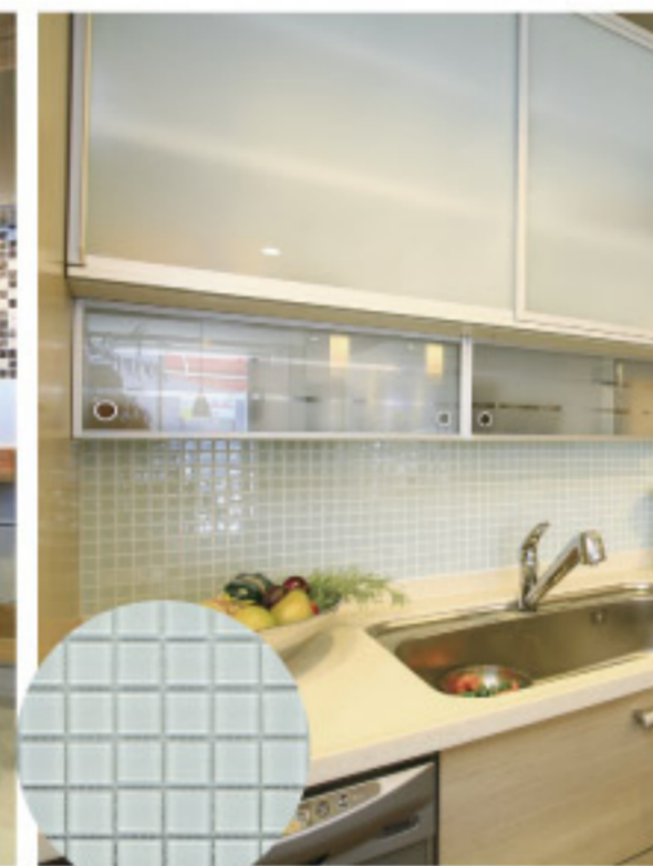
【13-4】ガラスモザイクタイル (ワウハウスケア)