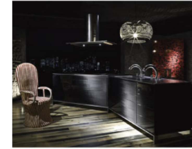
【14-4】INO カーボンファイバー (TOYOKITCHEN)