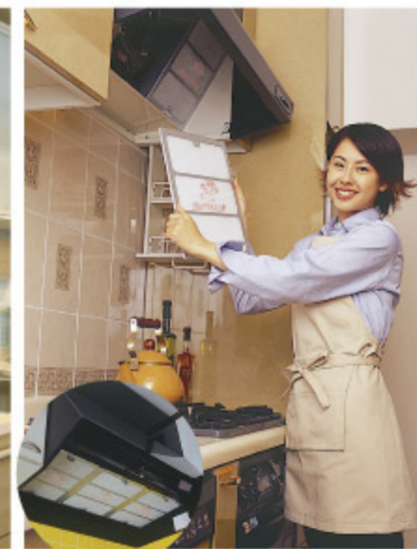
【13-5】レンジフィルター (クリーン・カラー)