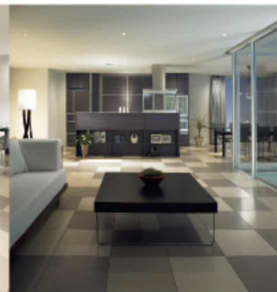
【13-7】pitto パーテーション対面キッチン (サンウェーブ)