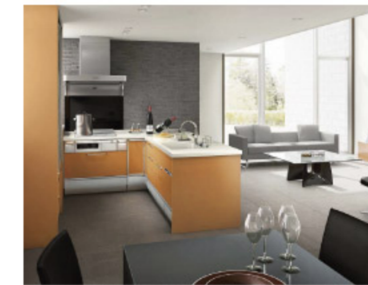
【14-7】クリンレディ STYLE 9 パーティスタイル フラット対面壁付けL型 (クリナップ)