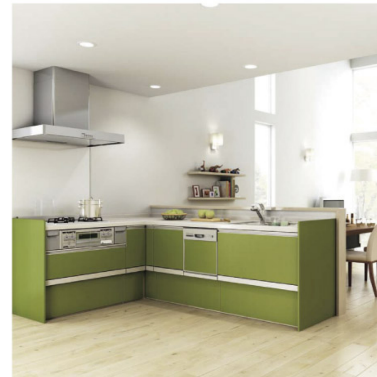
【14-6】システムキッチン ラクエラ Plan5 造作対面L型 (クリナップ)