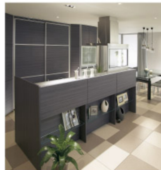
【13-6】pitto パーテーション対面キッチン (サンウェーブ)

家族との会話を楽しみながら料理が出来るアイランド型キッチン、高級感を印象づける人造大理石やシルバーのカウンタートップ、テキパキと作業のしやすい3口IHヒーターや健康を考えた浄水器、収納カップボードなど、デザイン性はもちろん機能性もしっかり考えて、わが家のシェフであるあなたが使いやすく、楽しく料理が出来る個性のあるキッチンを創りませんか。