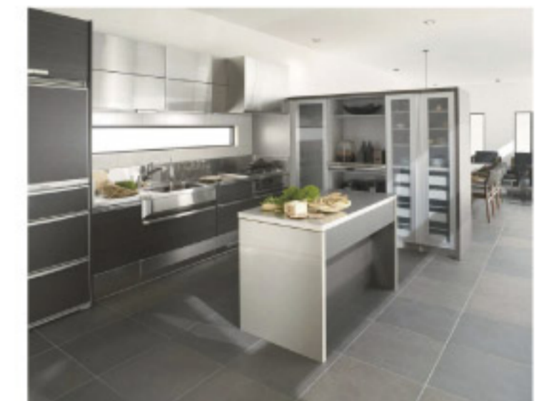
【14-10】Stainless System Kitchen アトリエプラン ブラックウッドSB3/レミナスリネアSK6 (クリナップ)