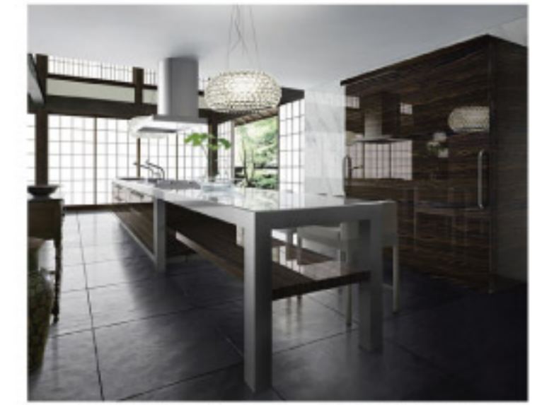
【14-3】ISOLA ボジターノ (TOYOKITCHEN)