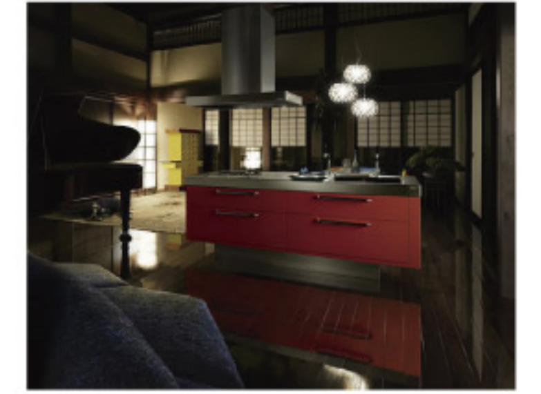
【14-5】ISOLA ロッソジャポネーゼ (TOYOKITCHEN)