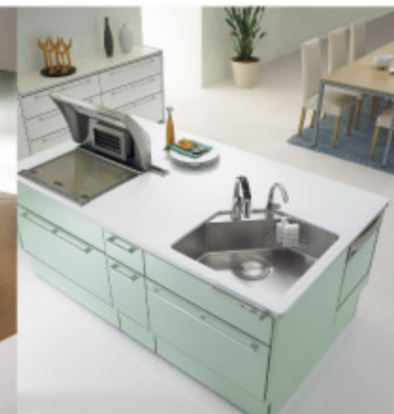
【13-9】pitto マルチアクセスキッチン (サンウェーブ)