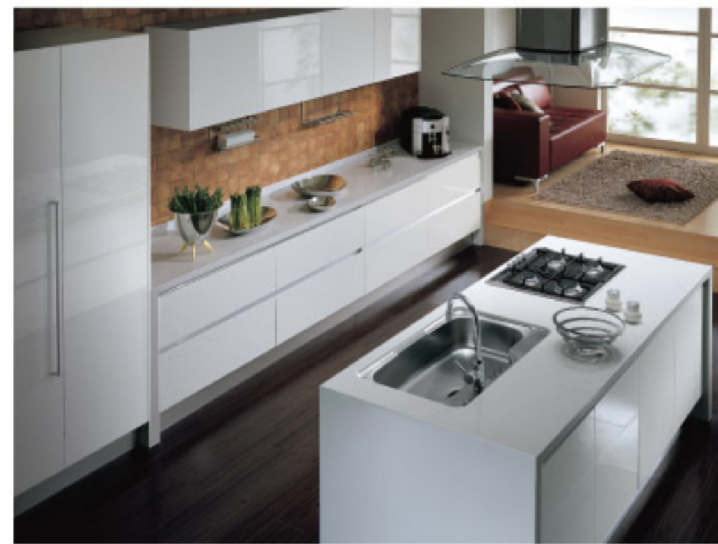
【13-2】オリジナルキッチン (RESEAU)