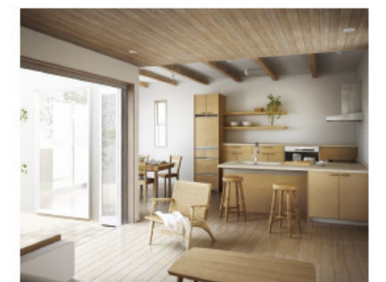
【14-14】Living Station L-class LD60シリーズ L型フラット対面+ハイカウンター壁付プラン (パナソニック電工)