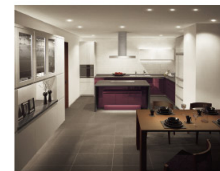
【14-13】Living Station L-class LA70シリーズ L型フラット対面+ハイカウンター壁付プラン (パナソニック電工)