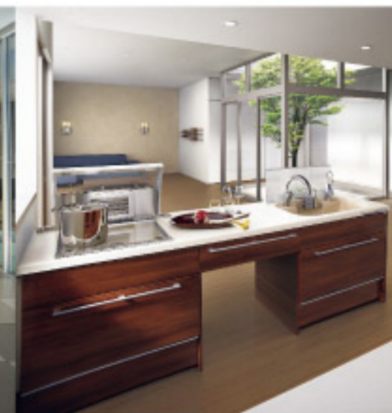
【13-8】pitto センターキッチン (サンウェーブ)