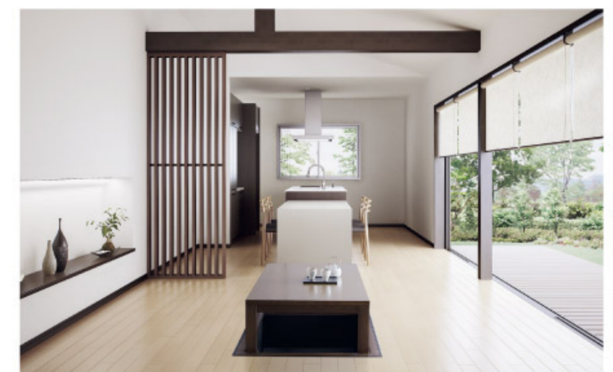
【12-14】 掘座卓 あったかへな (パナソニック電工)