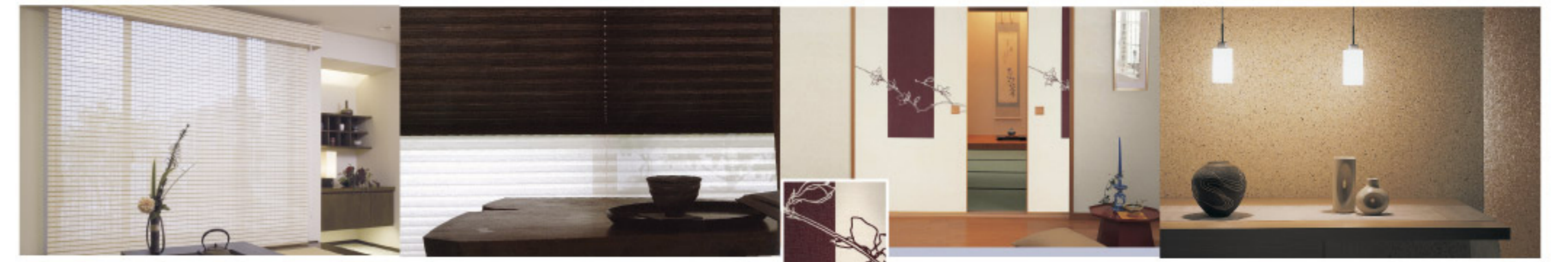
【12-1】 ロールスクリーン(タチカワブラインド) 【12-2】 プリーツスクリーン(タチカワブラインド) 【12-3】 デザイン襖紙(ムクダ) 【12-4】 自然素材クロス(葛散し) (Lilycolor)