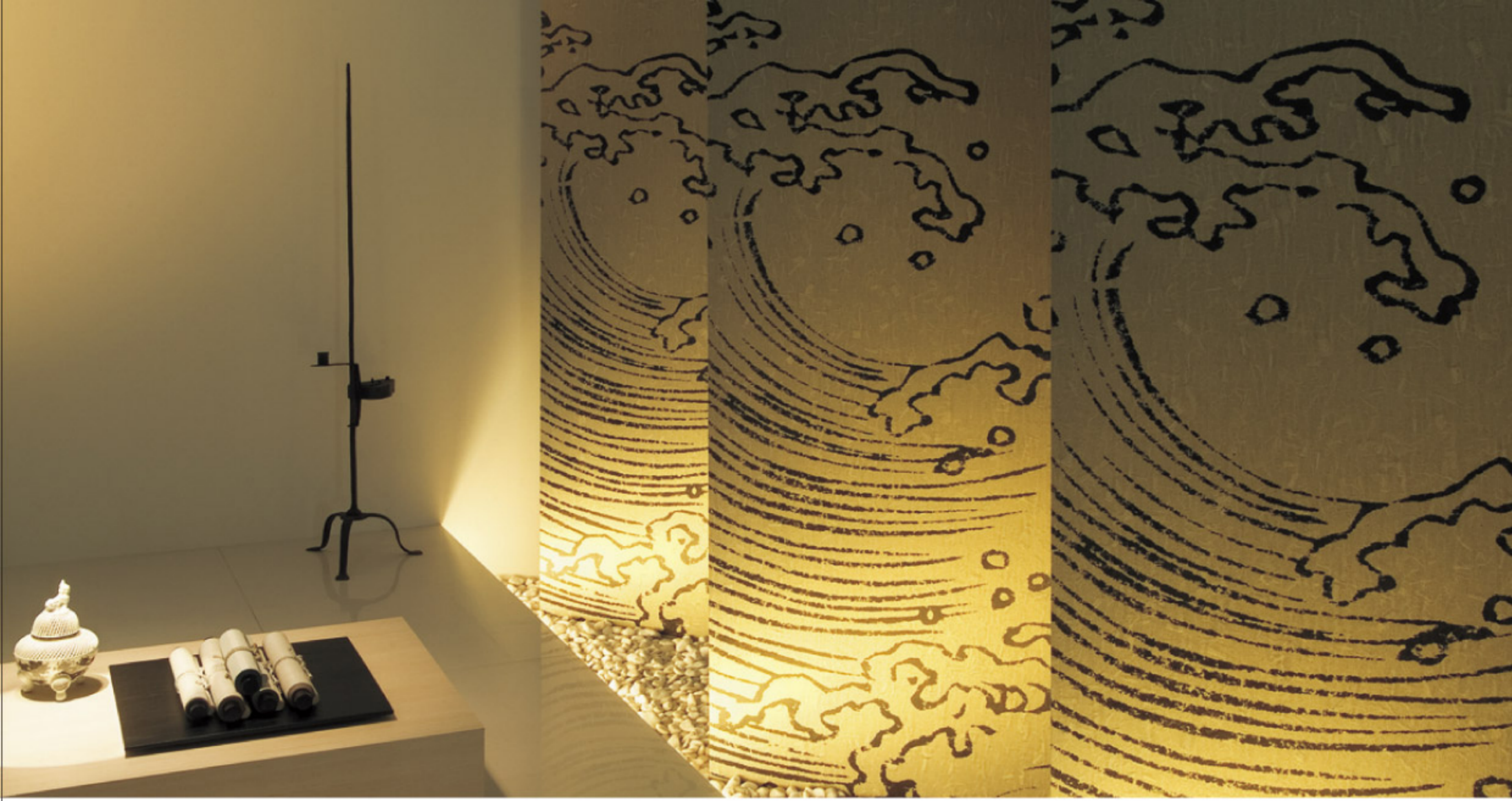
【11-1】 ジャパンインプレッション 波 (Lilycolor)