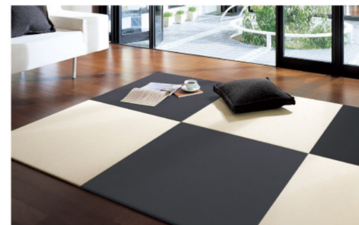
【12-13】 フレキシブルインテリアフロアー おくだけスパーN (DAIKEN)