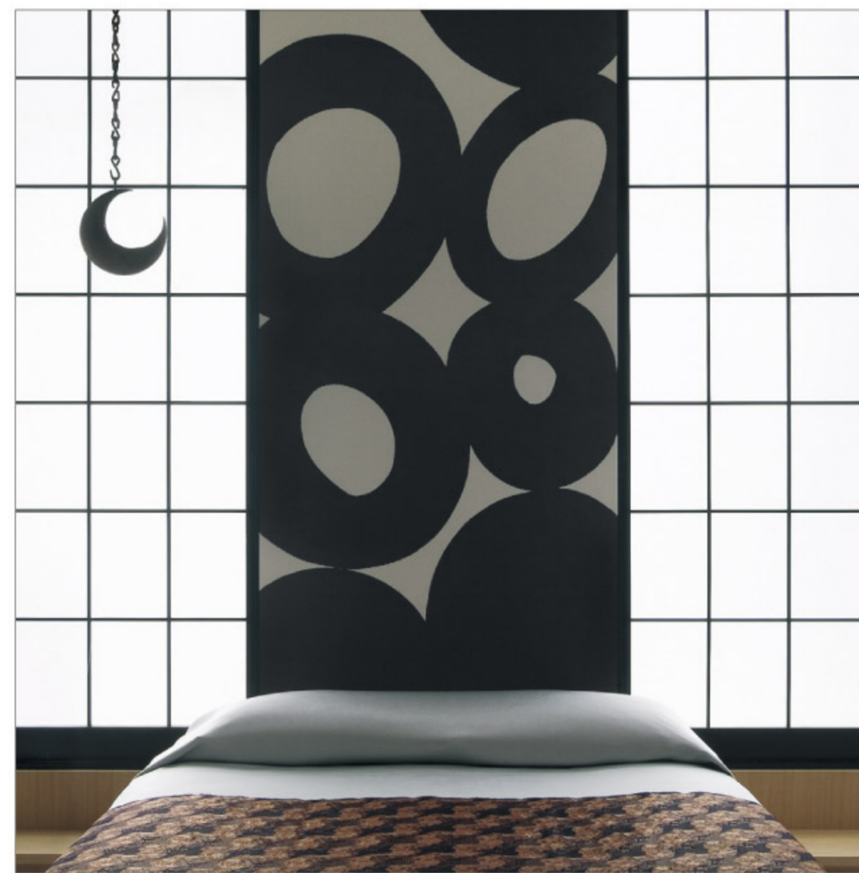
【11-2】 ジャパンインプレッション 玉 (Lilycolor)